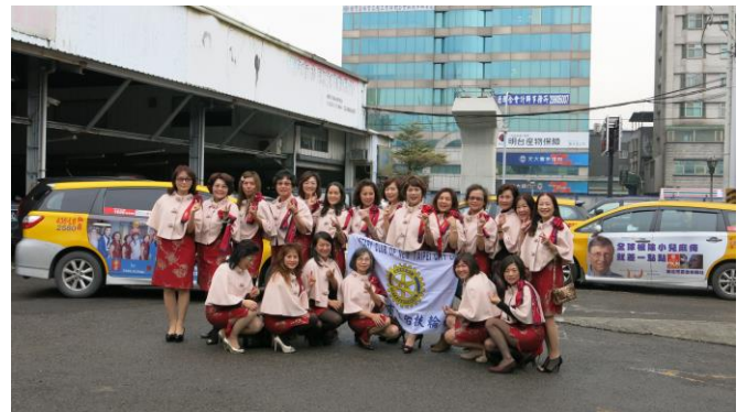
公共形象計程車廣告