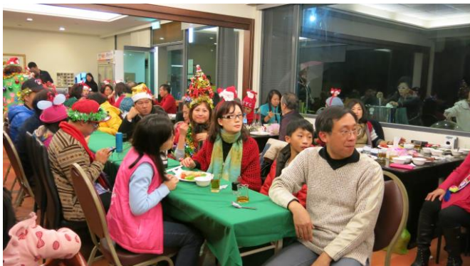
姑爺寶眷參加踴躍