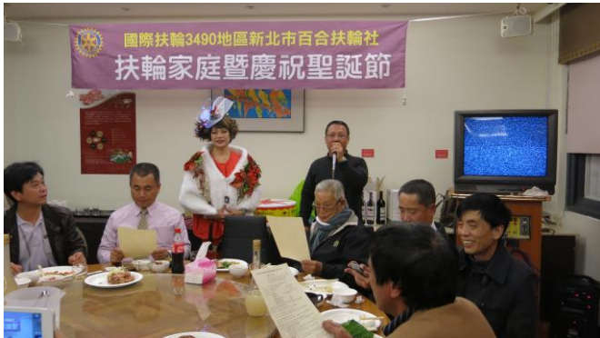
母社--泰山社社長致詞

◎地點：達利溫泉會館(新北市新店區環山路 156 號 電話：02-26616670)