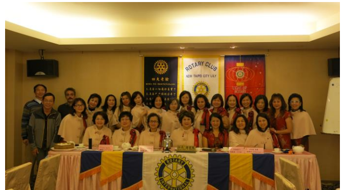
理事選舉圓滿成功