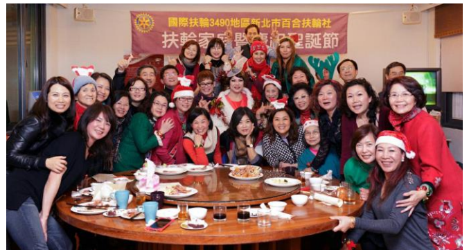
扶輪家庭聖誕晚會大圓滿