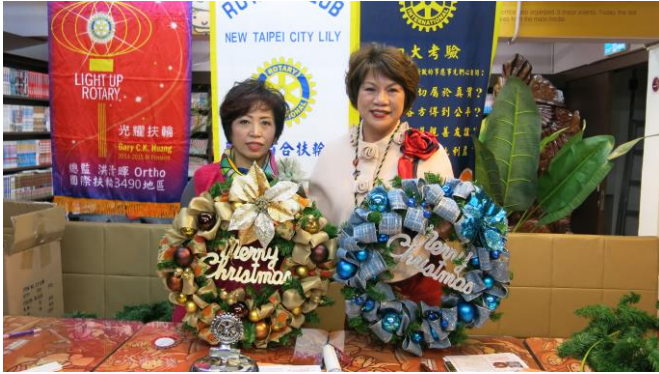
美麗的聖誕花圈成品