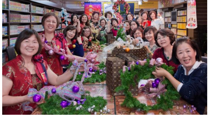
每位社友都興高采烈