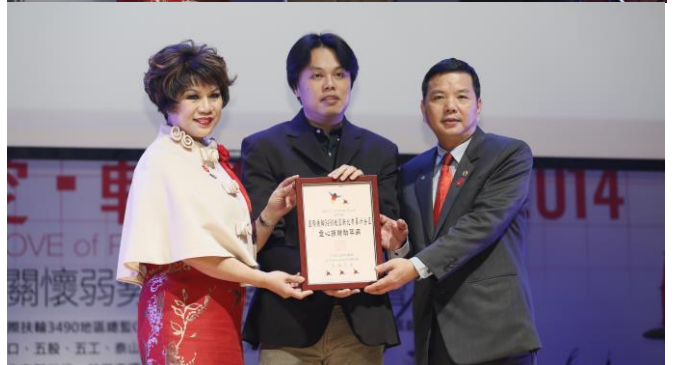
百合社及頭前社二位社長代表捐贈財團法人罕見疾病基金會支票/基金會回贈感謝狀