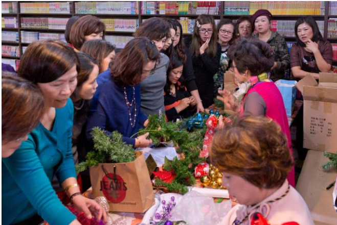
熱友們認真的學習