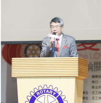
總監 Ortho 致詞

第 364 次例會 百合社刊第 363-364 期 2014 年 12 月 19 日