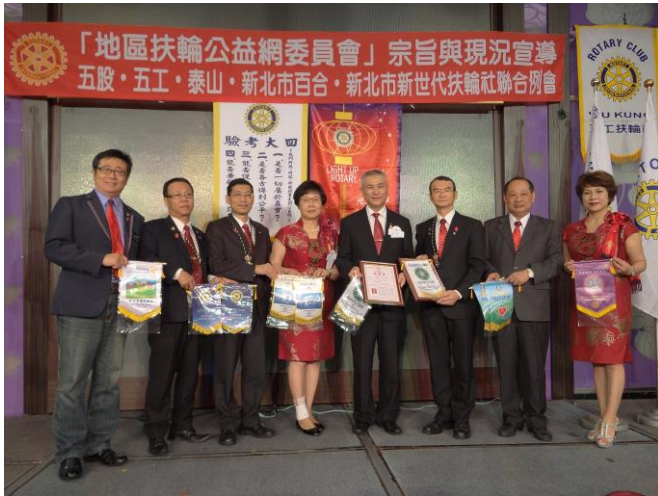
各社長致贈主講者小社旗