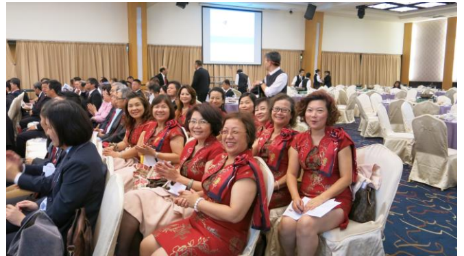
百合社友踴躍參與！