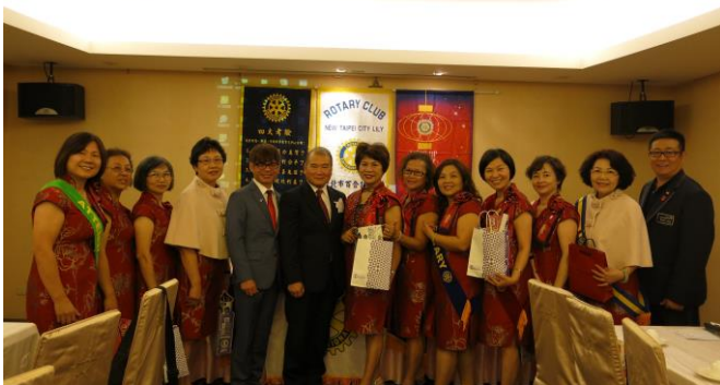
第一季全勤社友合影