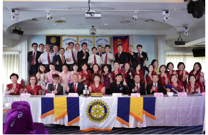
百合、泰山、新北市新世代社友全體合影