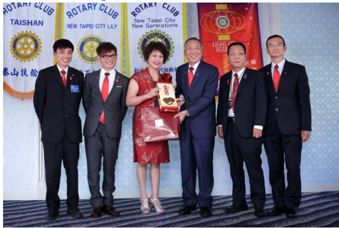
全體致贈前總監 Kega 紀念品