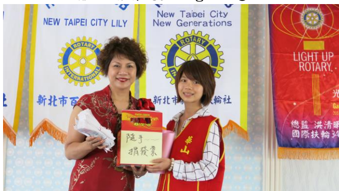
iPhone 社長捐贈華山基金會發票