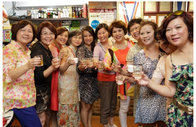
百合社美麗的前社長及未來社長