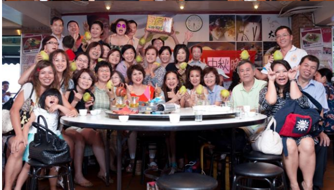
社友寶眷開心合影留念/ Iphone 社長致詞(下圖)