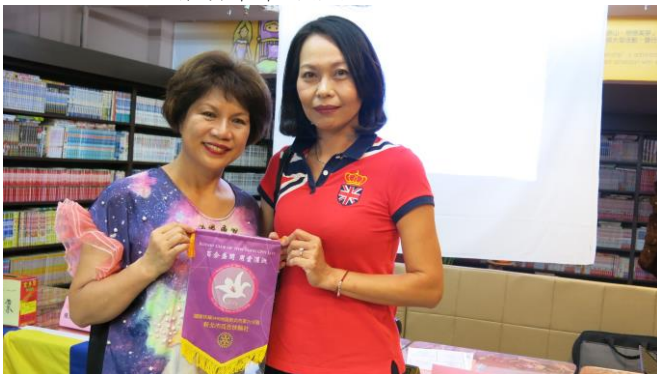
防災救護中心講師張小姐分享/廠商示範 AED(下圖)