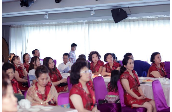
美麗的百合姐妹~專心聆聽總監的扶輪解析與指示

總監公式訪問是整個年度最有價值的例會，因地區總監受過 RI 年度特別訓練，能將年度工作目標及主題透過公式訪問直接與全體社友、伉儷面對面傳達訊息，對整個年度社務推動有莫大的助益。感謝社友姑爺們踴躍的出席！