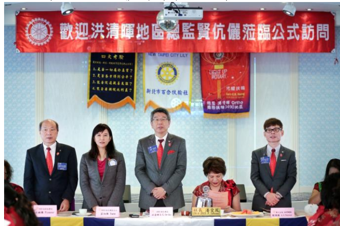
歡迎總監團隊蒞臨