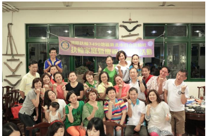
每位爸爸都變得年輕了