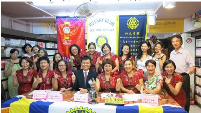
美麗的百合姐妹~真~善~美~