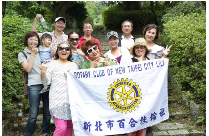
父親節登山健身有益健康