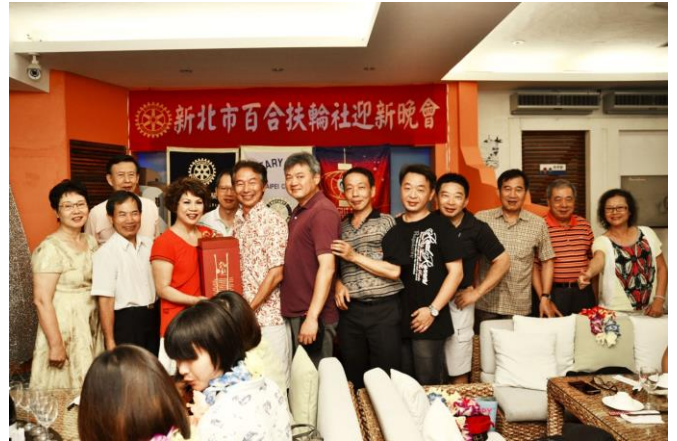
C.P.Lily 捐出 iPhone 社長贈送之 "女兒紅" 為晚會助興！