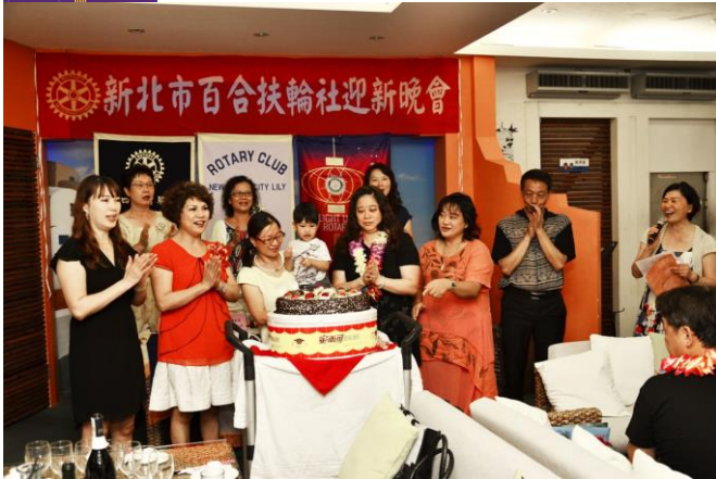
七八九月慶生活動