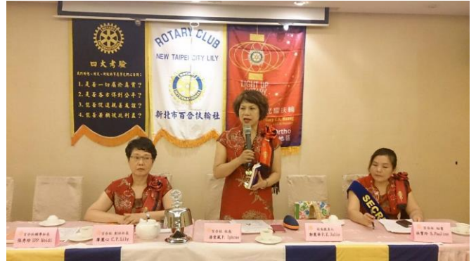
Iphone 社長第一次鳴鐘開會